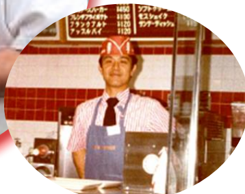
*名護店店長時代* (昭和57年頃)