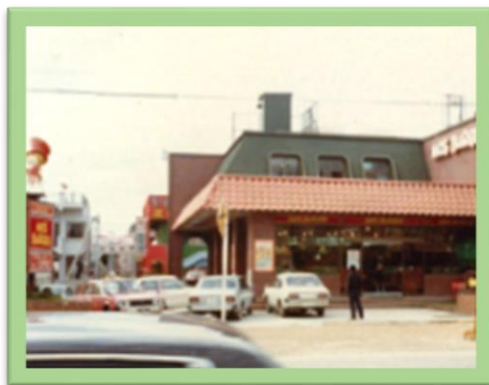
①コザ店（沖縄第1号店） 昭和51年12月開店