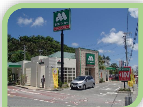
⑦沖縄知花店（コザ十字路店より移転） 平成4年9月開店