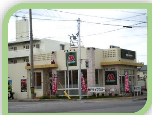
⑨那覇真嘉比店 平成26年3月開店