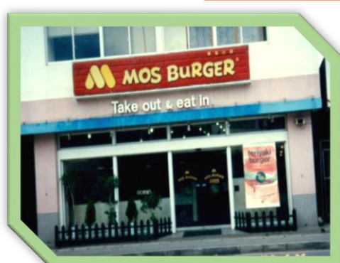
⑤具志川店 昭和59年5月開店