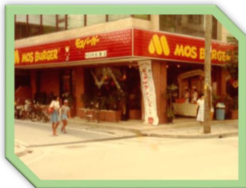
③名護店 昭和54年9月開店