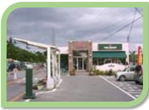
⑧名護バイパス店 平成9年10月開店