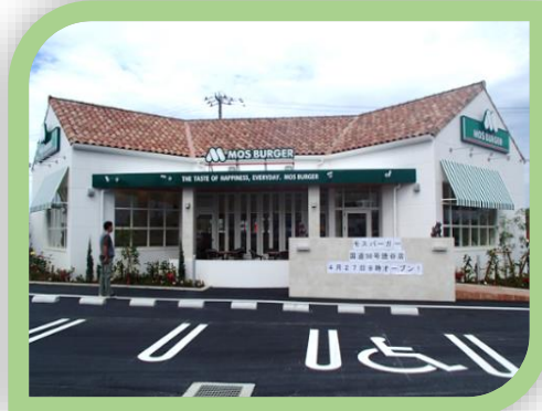
⑩国道58号読谷店 平成28年4月開店